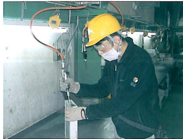
パソコンの解体・リサイクル