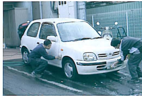
弊社本社リサイクルセンターの解体風景